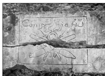
Effigie 43ª Compagnia primo conflitto mondiale

Nel prossimo futuro, la costruzione del sito dedicato all'Ecomuseo Val Resia che implementerà i contenuti presenti nella brochure e avvicinerà gli internauti ad una prima visita alle bellezze della Valle e alle sue potenzialità turistiche. ■