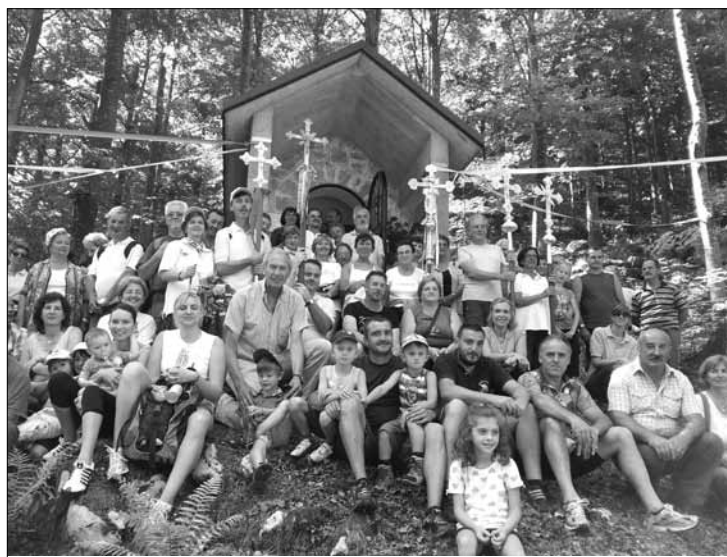
Inaugurazione restaurata cappelletta votiva a Sella Carnizza

Si attendono grandi novità, tra cui quella annunciata di una revisione del sistema ricettivo e dell'utilizzo dei poli anche nei periodi estivi. ■