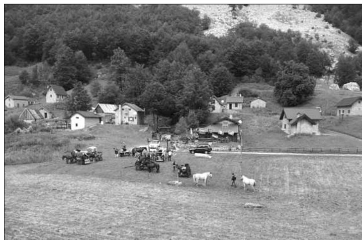
Carrozze e cavalli nella splendida cornice di Sella Carnizza

Meritevoli di menzione, gli organizzatori del "Kris" di Gniva, che anche quest'anno hanno rinnovato la solidarietà al Centro con la donazione di due pale a soffitto. ■