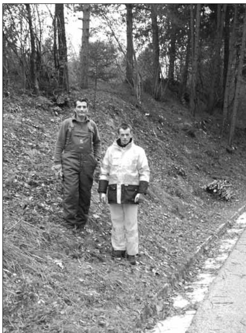
Al servizio della Comunità

capogruppo consiliare "UN FUTURO PER RESIA"