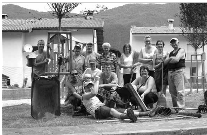
Giornata ecologica a Gniva