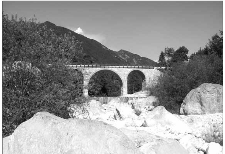
Veduta del Ponte Rop