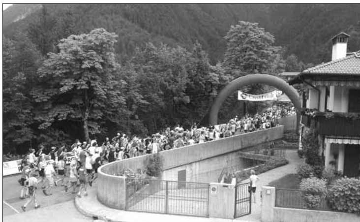
La partenza della Vertical Kilometer 2013

seppur esigua numericamente, esiste ed è vitale. La concertazione di