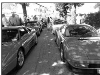
Le Ferrari sfilano come modelle a San Giorgio

2013, diversi dei quali su iniziativa di giovani ed