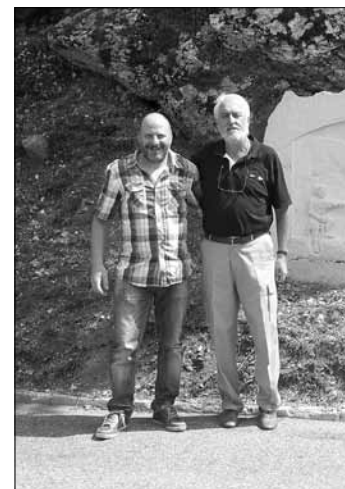
Il Sindaco e l'artista

La visita al fabbricato ha reso edotti i visitatori dello