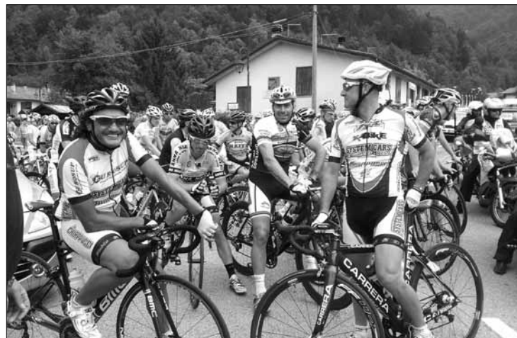
Un sorridente Claudio Chiappucci alla partenza del Giro del Friuli ad Oseacco

Tale possibilità, tuttavia, potrebbe ricevere chances di concretizzazione qualora la condizione della viabilità stradale in Valle, e nello specifico la direttrice per Ucea, dovesse incontrare la sensibilità di enti sovramunicipali al fine di ricevere idonei finanziamenti. ■