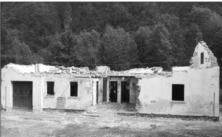
Iniziati i lavori di recupero della ex-Casermetta Alpini di Lischiazze