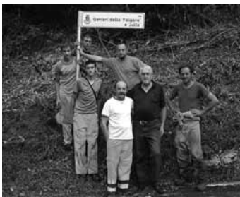
Giovani borsisti, Sindaco e operai davanti all'indicazione della nuova Via

L'occasione è stata data dall'intitolazione della strada comunale che conduce a Coritis, fortemente voluta dal Corpo dei genieri della Julia e della Folgore che la costruirono tra il 1958 e il 1961.